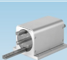
X6414 / X6416