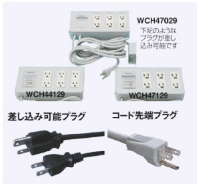
差し込み可能プラグ コード先端プラグ

● 抜け止めタイプは、平型2芯や接地付き平型2芯などの一般的なプラグを差し込んでひねるだけで抜け防止のロックをさせることができます。