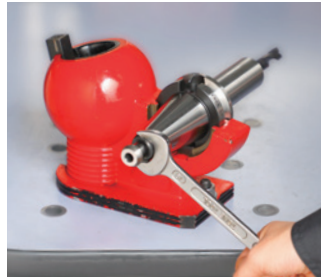
プルスタッド締付け