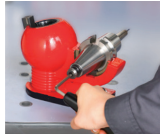
スリムラインコレット締付け