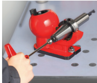
データワンコレット締付け (DTB)