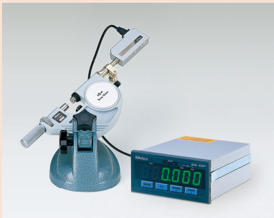
リニヤゲージ装着例