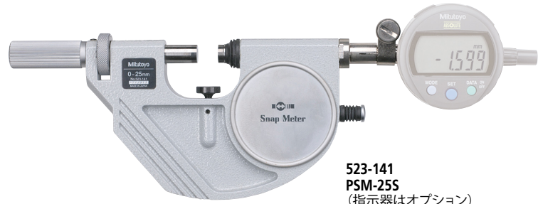
523-141 PSM-25S (指示器はオプション)