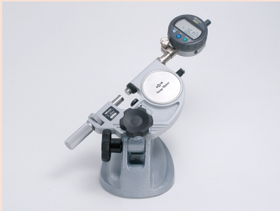
ABSデジマチックインジケータ装着例