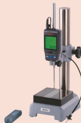
リモコン リフティング用レリーズ