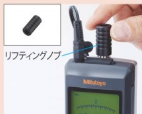
リフティングノブ