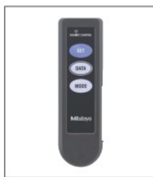
リモコン(オプション)