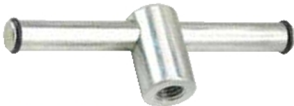
PM 0808 (M8)