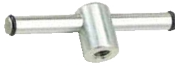
PM 1010 (M10)