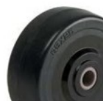
EM (50mm, 65mm)