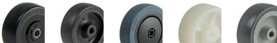
EM (50mm, 65mm)