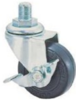
SR-50 RM S-1