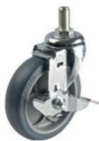
SM-100 TP S-2