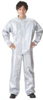
AWW2シリーズ (作業ズボン) (靴別売)