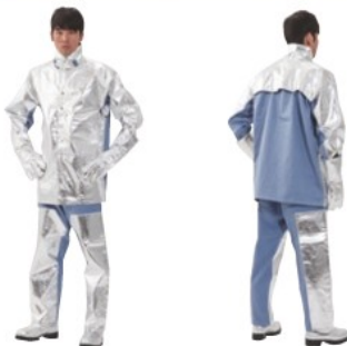
5020シリーズ+5021シリーズ (上着+ズボン) (手袋・靴別売)