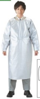
AMA3シリーズ (袖付エプロン) (ズボン・靴別売)