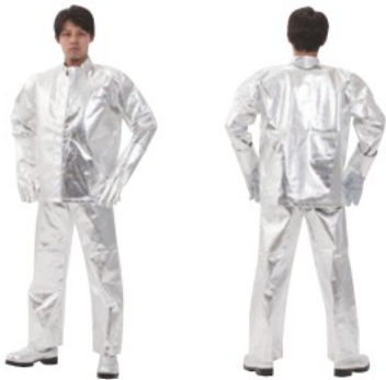
5010シリーズ+5012シリーズ (上着+ズボン) (手袋・靴別売)