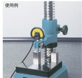
株式会社ミットヨ [894408]

特長 ●上下の微動に平行ばねを使用していますので、ワンタッチ操作で微動できます。 ●ダイヤルゲージの保持に。 仕様 ●取り付け穴:8mm 製造国 ●中国