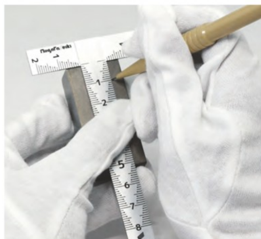
小型ワークの加工・ケガキ作業に