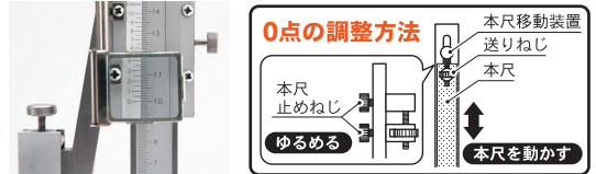
本尺目盛部 拡大レンズ (VHK-15)