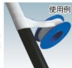
ニチアス株式会社[743057]