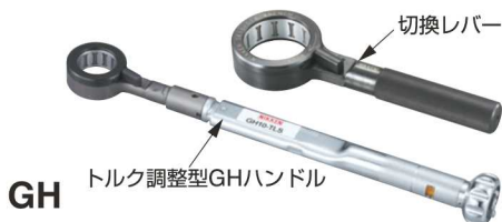
GH トルク調整型GHハンドル

高速回転ツール用の切換式ワンウェイクラッチハンドルです。切換レバーを切り換えるだけで、締付/緩めが簡単に、軽いトルクでラチェット操作で行なえます。特に、刃物突出長の調整に便利です。チャック先端は切欠のないシンプルでコンパクトな形状となりました。