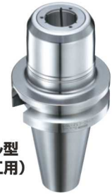
本体シール型 (アルミ加工) GFS