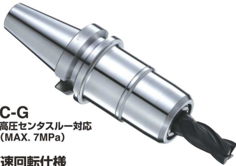
C-G 高圧センタースルー対応 (MAX. 7MPa)