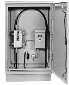
[CATV用電源など組込み例]

注意 ボックスの構造上、内部に雨水などが入りますので、 収納機器のご選定の際にはご注意ください。