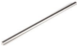
ロングピン m6 S45C