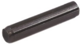
溝付きピンC形 DIN 1473