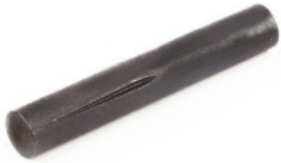
溝付きピン D形 DIN 1474