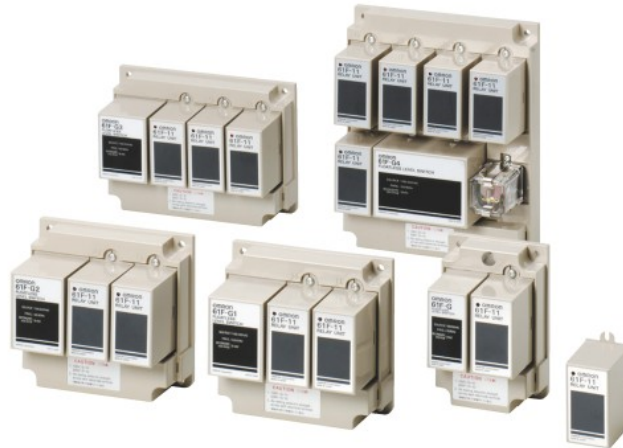
形61F-□(□)-TDL (AC100/200V)は、2018年3月末に受注終了いたしました。