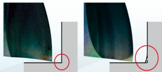
ピンカドタイプ(-SP) Sharp Corner Edge

Effective corner milling with no uncut residue left behind.