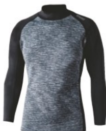
JW-186-49 (ハイネックシャツ) (カモフラ/ブラック)