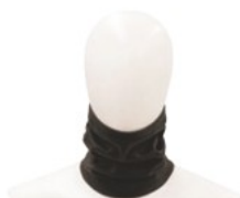
TO-26100010 (ネックウォーマー)