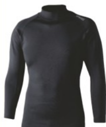
JW-186-11 (ハイネックシャツ) (ブラック)