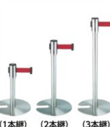
(1本縦) (2本縦) (3本縦)