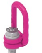
VLBG-PLUS-Lシリーズ (ロングボルトタイプ)