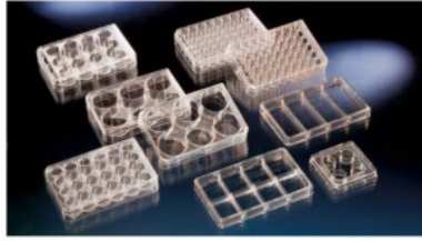
マルチディッシュ