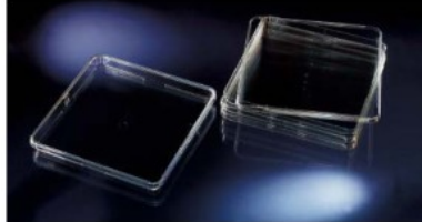
バイオアッセイディッシュ