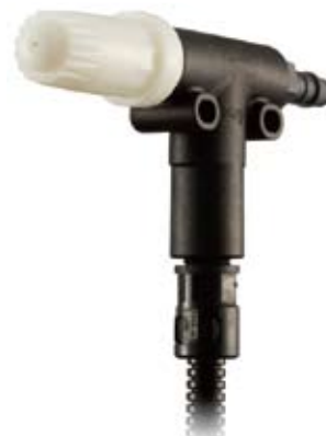
R36-RR (ラウンド、ライトアングル)