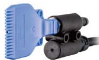
R36-AF (フラット、ストレート)

製品の形状や用途に合わせてノズルの吹き出し形状や高圧ケーブルの取り出し方向などが選択できます。