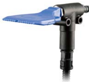
R36-RF (フラット、ライトアングル)