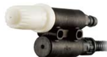
R36-AR (ラウンド、ストレート)