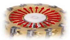
クーラント噴出方向