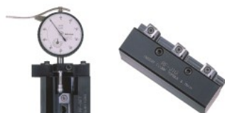
セッティングゲージ RF-SET (別売・標準在庫品) クランプ治具 RF-JIG (別売・標準在庫品)