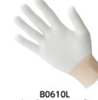
B0610L (レギュラータイプ)