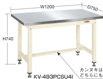
KV-493PCSU4I カンヌキは中央と後側のどちらにも取付可能です。