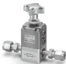
LVH20M-D07-AD ダブルフェルール継手