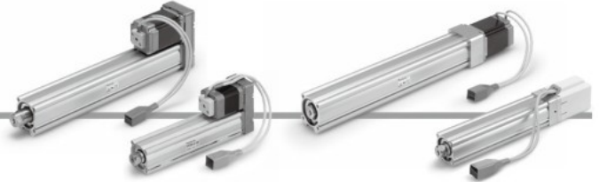
モータ配置：折返し