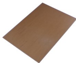
3030090WL-CB (チェストナットブラウン)