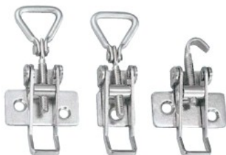
TF702C-CR TF702SC-CR TF702HC-CR