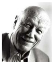
ヘニング・ラーセン