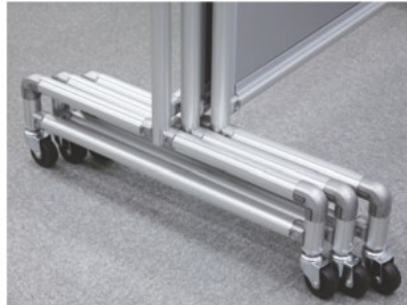
●脚部が重ねられますので収納時スペースをセーブできます。