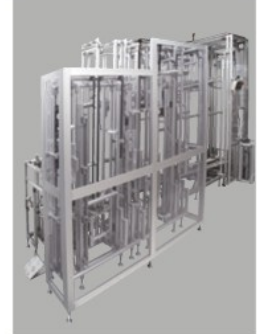
●カバーフレームによるパーティションは P.273をご覧ください。