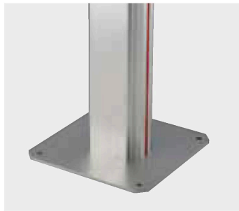
アンカータイプも選べます。