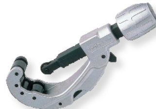
TC205 (面取用ナイフ・スパー用替刃付)