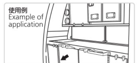
使用例 Example of application