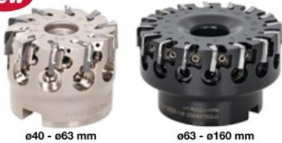
ø40 - ø63 mm