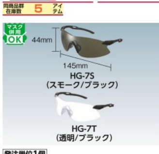
HG-7S (スモーク/ブラック)