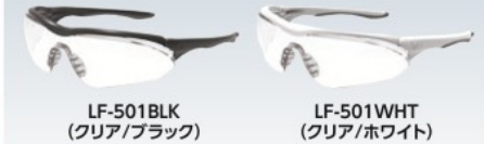
LF-501 BLK (クリア/ブラック)