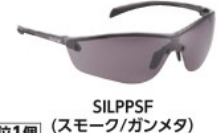
SILPPSF (スモーク/ガンメタ)

特長 ●超軽量で快適な掛け心地です。 ●防曇、耐傷に優れたプラチナコーティングです。 ●ポーチ同梱です。