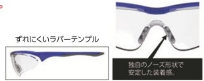
ずれにくいラバーテンプレート

仕様 ●JIS T 8147規格品 ●レンズ厚:約2.3mm ●レンズ:ポリカーボネート ●フレーム:プラスチック 製造国 ●日本