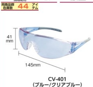
CV-401 (ブルー/クリアブルー)

特長 ●色をはっきり見れる視認性向上グラスです。 ●塗装ムラや異物検査、外観検査に適しています。