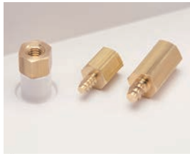
タッピングスペーサー TPSシリーズ P1-123