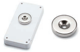
壁付マグネット NMGシリーズ P13-25