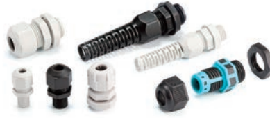
ケーブルグランド P5-67~75