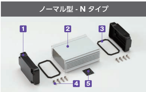
ノーマル型 - N タイプ