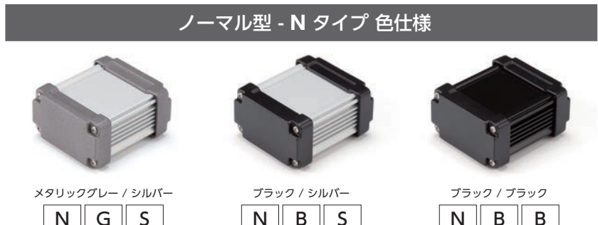
ノーマル型 - N タイプ 色仕様