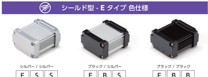
シールド型 - E タイプ 色仕様