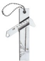
TG-DP118 (ボールチェーン付)

特長 ●直径3~45mmまでのドリル切り刃の長さ、角度の左右対象が同時に測定できます。●回転子による角度設定は、被切削材先端角度ゲージとして便利です。(先端角60・70・90・125・135・150°目盛付) 用途 ●ドリル切り刃の長さ、ドリルの先端角度、チゼルエッジの偏芯、リップ高さ差の測定に。 材質 ●メインスケール・回転子: ステンレス(SUS420J2) ●ベース:一般構造用圧延材 製造国 ●日本