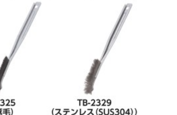
TB-2325 (黒豚毛) TB-2329 (ステンレス(SUS304))

特長 ●従来のチャンネルブラシに比べてハンドルが持ちやすく、長時間使用しても指が痛くなりにくいです。 ●ハンドル部分には環境適応物質のメッキ処理をしています。 ●柄の後ろの部分がへらの形状になっているので、こびりついた汚れを落とすのに適しています。 用途 ●金属面のサビ取り、バリ取り、塗装はく離など。 ●手作業の範囲の、比較的、軽作業向き。 製造国 ●日本