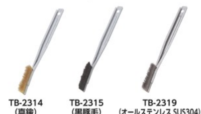
TB-2314 (真鍮) TB-2315 (黒豚毛) TB-2319 (オールステンレス SUS304)