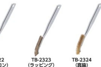
TB-2322 (66ナイロン) TB-2323 (ラッピング) TB-2324 (真鍮)