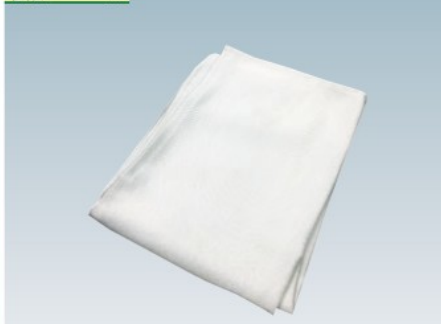
TSC-06タイプ (ハトメなし)