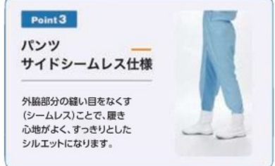
Point 3 パンツ サイドシームレス仕様 外股部分の縫い目をなくす(シームレス)ことで、履き心地がよく、すっきりとしたシルエットになります。