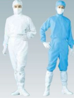
FH199C-01 (ホワイト) FH199C-02 (ブルー) (フード・マスク・手袋・シューズ別売)

特長 ● 汎用性の高いシンプルな防塵服です。 仕様 ● ISO Class6 (FED/STDクラス1000) 相当品 材質 ● ポリエステル 製造国 ● 中国