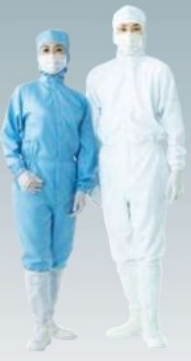
FH197C-02 (ブルー) FH197C-01 (ホワイト) (マスク・手袋・シューズ別売)

特長 ● 汎用性の高い防塵服です。 ● フード一体型なので管理が容易です。 用途 ● 半導体・液晶パネル・電子部品・印刷・写真・通信・精密機器。 ● 医薬品・バイオ・化学・包装。 ● 食品工業。 仕様 ● ISO Class6 (FED/STDクラス1000) 相当品 材質 ● ポリエステル 製造国 ● 中国