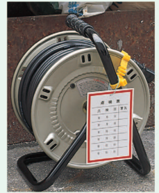
321-01 両面表示 サイズ: 150×100×1mm厚 材 質: エコユニボード (3mmφ穴上1)