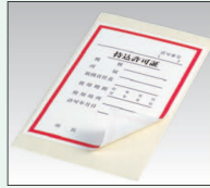
321-02 10枚1組 ステッカー サイズ: 150×100×0.08mm厚 材 質: PPステッカー