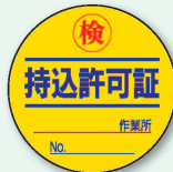
321-08 10枚1シート ステッカー サイズ: 50φ×0.08mm厚 材 質: PVCステッカー