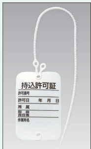
477-18 10枚1組 サイズ: 表示面/70×45×1mm厚 結束部/200mm 材 質: 軟質プラスチック