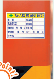
321-04 ステッカー サイズ: 100×150×0.08mm厚 材 質: PPステッカー