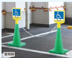
■ コーン → P.359