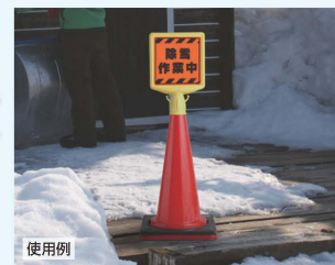
■ コーン (385-01) → P.359

共通 本体サイズ：412×280×88mm 本体材質：高密度ポリエチレン 本体重量：約0.4kg 表示サイズ：250×250mm 表示材質：蛍光ステッカー (付属品) ネジ2個