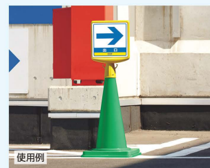
■ コーン → P.359