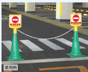
■ コーン → P.359 ■ ロープ・チェーン → P.468

共通 本体サイズ：412×280×88mm 本体材質：高密度ポリエチレン 本体重量：約0.4kg 表示サイズ：250×250mm 表示材質：PVCステッカー (付属品) ネジ2個