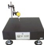
UBV3030 (微動調整機能付) ダイヤルゲージ別売