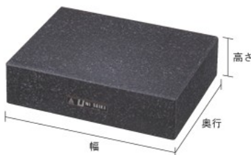
U1タイプ (グラナイト石定盤 1級)