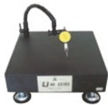
UFX3030 (フレキシブルアーム付) ダイヤルゲージ別売