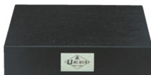
U1-4560 (調整ボルト付グラナイト石定盤 1級)